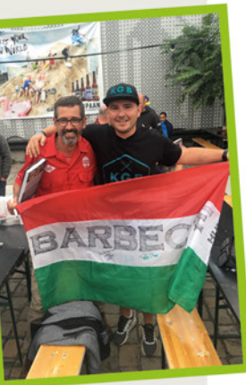
A háromszoros világbajnokkal Tuffy Stone-nal

www.patentgasztrobar.hu www.tekergoetterem.hu