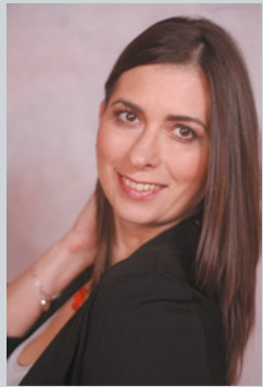
A szerzőről: Kegyé Kriszti Kri – Design Belsőépítészet, lakberendezés, bútortervezés, styling

Székesfehérvár, Budapest Tel: +36 20 483 4884 • info@kri-design.hu • www.kri-design.hu