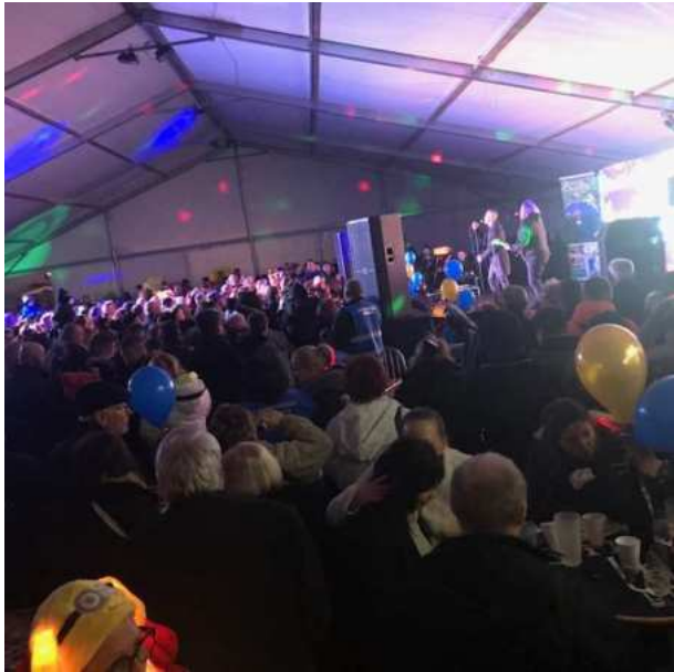
Hangosítás, fénytechnika, színpad, LED fal