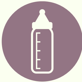
Bébiétel melegítési lehetőség